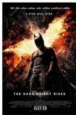
역대 순위 7위 $448,139,099