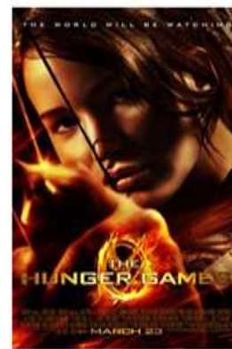
역대 순위 13위 $408,010,692