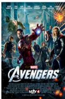
역대 순위 3위 $623,357,910