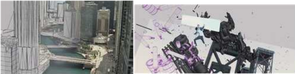
마이클 베이 감독의 트랜스포머의 배경과 VFX 장면