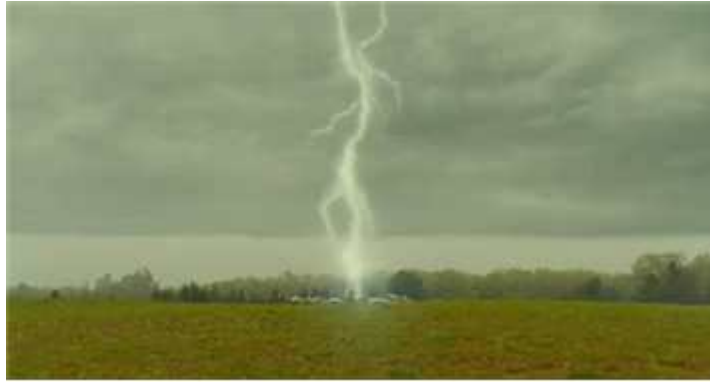
<문라이즈 킹덤(2012)> 예고편의 VFX 장면