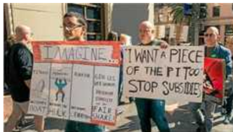
80년대부터 많은 VFX를 개발 제작했던 스튜디오들