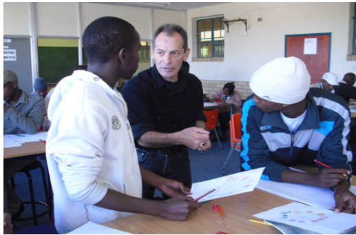
아드만 스튜디오 애니메이션 스쿨