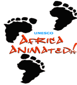
유네스코 애니메이션 워크숍

실제로 이러한 노력의 결과로 남아프리카에는 많은 애니메이션 기업들이 생겨났으며, 영화 및 애니메이션 산업에서 그 비중이 점차 커지고 있는 3D와 VFX(시각효과) 등 컴퓨터 그래픽 기술을 다루는 기업들이 많은 비중을 차지하고 있어 아프리카 애니메이션 산업 미래는 긍정적으로 전망되고 있다.