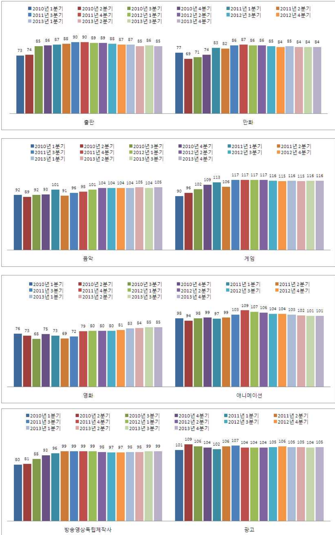
<그림 1> '10년 1분기~'13년 4분기 콘텐츠산업별 CBI